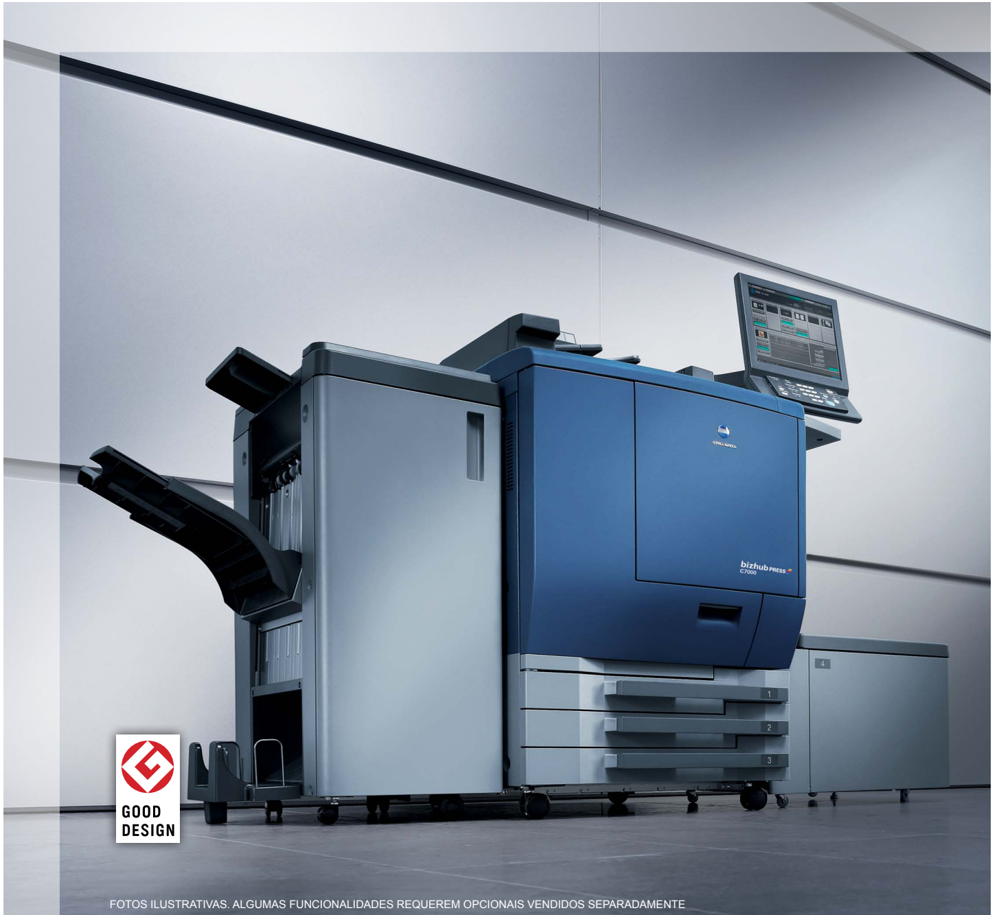
FOTOS ILUSTRATIVAS. ALGUMAS FUNCIONALIDADES REQUEREM OPCIONAIS VENDIDOS SEPARADAMENTE